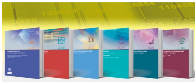
Informes Anuales Cepal 2017