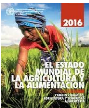
Estado Mundial de la Agricultura y la Alimentación FAO 2016