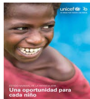
Estado Mundial de la Infancia 2016