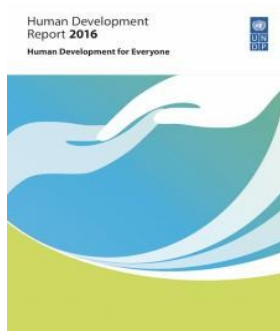
Informe de Desarrollo Humano 2016