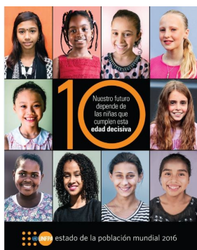
Estado de la Población Mundial 2016