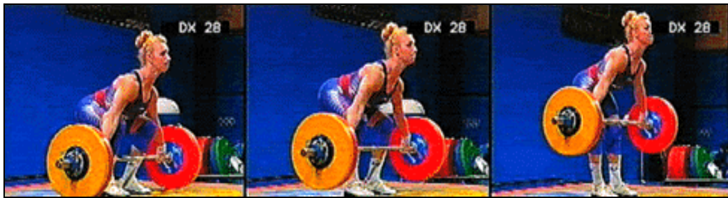
Figura 1. Primera fase.

Segunda fase (Figura 2) La atleta debe realizar: