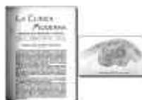
Fig. 9. Publicación de un caso de tuberculosis "exuberante", que planteó el diagnóstico clínico de tumor maligno.

a) Fue pionero en España en la realización sistemática de biopsias pre-operatorias e intra-operatorias. De hecho, algunas de sus publicaciones revelan la importancia de dichos estudios en patologías donde procesos inflamatorios crónicos exuberantes llegaban a confundirse clínicamente con tumores malignos (fig. 9).