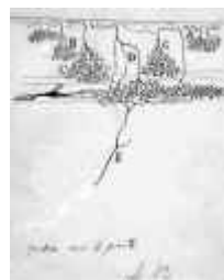
Fig. 5. Dibujo de Pedro, representando las aferencias retinianas en el lóbulo óptico de las aves.

En 1891 su hermano Santiago, trabajando en Barcelona, retoma el problema de la polarización del impulso nervioso, instigado por las críticas de Van Gehuchten. Pedro pone a su disposición todas sus preparaciones sobre el lóbulo óptico de batracios, reptiles y aves. En estas magníficas preparaciones Santiago encontró lo que no había visto en las suyas, plexos nerviosos terminales (fig. 5) en lugar de una maraña de dendritas. Estas observaciones y los hallazgos encontrados por Pedro ayudaron de manera decisiva a Santiago a enunciar su Ley de la Polarización Dinámica.