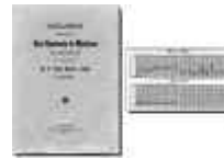
Fig. 14. Descripción de las fiebres de Malta.

1914 ingresa en la Real Academia de Medicina de Zaragoza y elige este tema de investigación para el discurso de ingreso, que dictará bajo el título de Fiebres de Malta en Aragón (fig. 14).