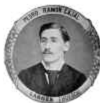
Fig. 4. Pedro Ramón y Cajal.

Regresa Pedro a España en 1878 contando 24 años de edad y comienza a estudiar Medicina en la Universidad de Zaragoza. En 1879 consigue por oposición ser nombrado alumno interno pensionado de Anatomía. Su licenciatura, con grado de sobresaliente, data de Octubre de 1881 (fig. 4).