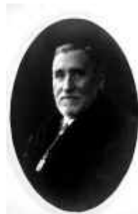
Fig. 8. Pedro Ramón y Cajal en la época de su jubilación como catedrático, con 70 años.

En Octubre de 1924 Pedro recibe la jubilación en su Cátedra de la Universidad, al cumplir los 70 años de edad (fig. 8).