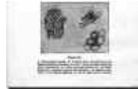
Fig. 12. Dibujos de un tumor de mama que mostró mayor indiferenciación en la recidiva.

d) Destaca también como los tumores malignos van haciéndose progresivamente mas malignos y como ejemplo pone casos de recidiva de canceres de mama, con características histológicas mas atípicas e indiferenciadas en las recidivas (fig. 12).