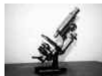
Fig. 6. Microscopio Zeiss con el que Pedro realizó la mayoría de sus trabajos histológicos.

Vamos a dar un repaso muy somero a su labor investigadora con el fin de hacernos una idea de la magnitud e importancia de la misma (fig. 6).