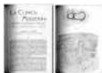
Fig. 10. Publicación de un caso de quiste dermoide de ovario donde discute su histogénesis.

b) En sus trabajos de la histología e histopatología ovárica, destacan los estudios sobre la invasión ovárica, folículos ováricos y distintos tipos de tumores, como el quiste dermoide, donde discute su histogénesis (fig. 10).